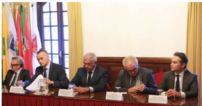
El Presidente de la CEP, Jorge Cebreiros, asistió en Caminha a un encuentro de empresarios gallegos y lusos con el ministro portugués de Economía, Manuel Caldeira Cabral, con el fin de analizar las opciones para incrementar la cooperación empresarial y el desarrollo en la Eurorregión Galicia-Norte de Portugal.