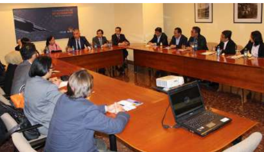
La Embajadora de Indonesia en España, Yuli Mumpuni, y el comisionado especial del presidente indonesio y exministro de exteriores, Hassan Wirajuda, visitaron la Confederación a finales de mayo para conocer las oportunidades de negocio que ofrece la provincia y valorar la posibilidad de cooperación con empresas pontevedresas.